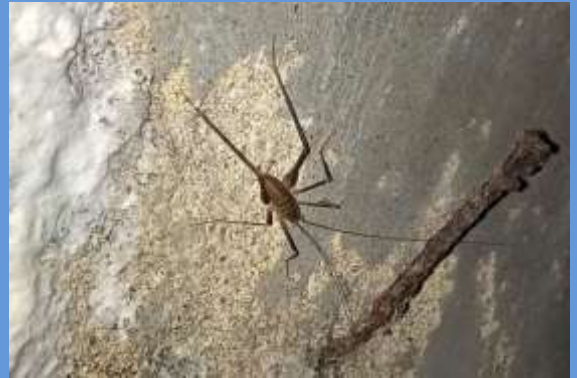
Dolichopoda schiavazzii fotografato all'interno delle sorgenti di Colognole facenti parte dell'Acquedotto Lorenese