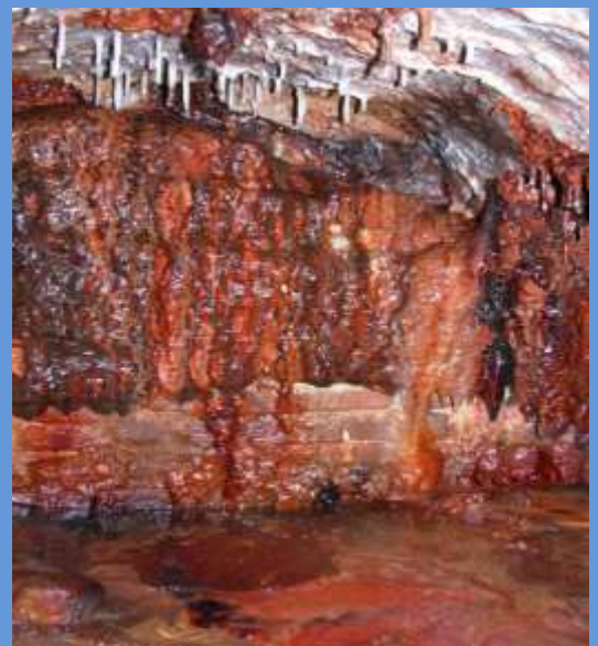
Acquedotto romano della Val di Setta, Bologna, Italia (concrezioni su un tamponamento del 1890)